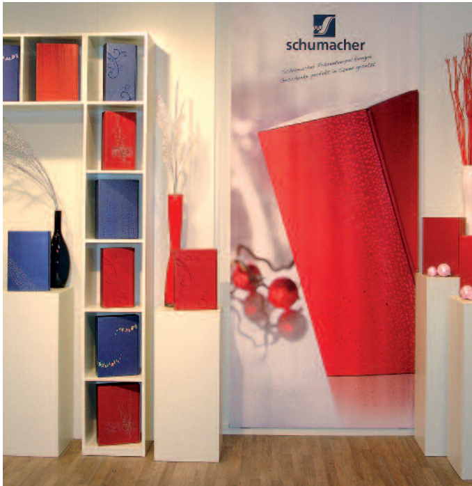
Die ganze Vielfalt der Geschenkverpackungen gibt es im Showroom zu sehen.

Zum 1. Januar 2010 hatte die Schumacher Packaging Gruppe, ein mittelständischer Hersteller von maßgeschneiderten Verpackungen aus Voll- und Wellpappe, die Wasgau Packaging GmbH aus Hauenstein übernommen. Nach zwei Jahren zieht das Familienunternehmen in Hauenstein eine erste Bilanz – und die fällt positiv aus.