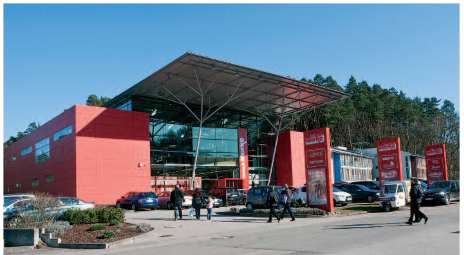
Das derzeitige Haupthaus in der Hauensteiner Industriestraße