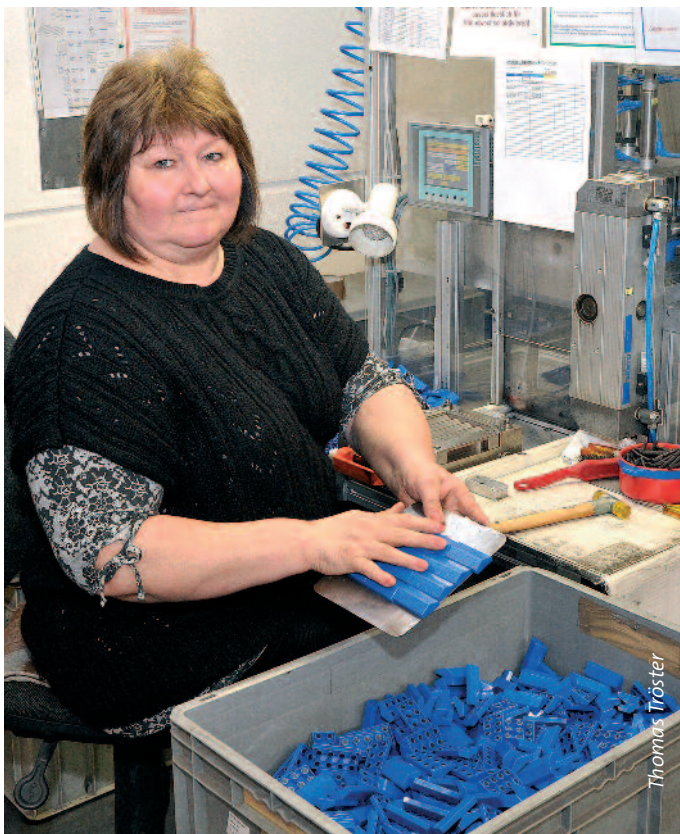
Die Halbfertigteile für seine Produkte fertigt der Ramberger Spielwarenhersteller Theo Klein in Landau.