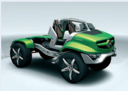
So könnte der Unimog in Zukunft aussehen.

Die Designstudie des Unimog hat den begehrten „red dot award design concept“ erhalten. Die Preisträger in den verschiedenen Kategorien wurden aus über 3.000 eingereichten Projekten ausgewählt. Es nehmen Unternehmen, Institutionen, Forschungszentren und Design-Studios teil. Die Designstudie wurde im Sommer 2011 anlässlich des 60-jährigen Bestehens des Unimogs vorgestellt und gibt einen Ausblick auf die künftige Formensprache des Nutzfahrzeugdesigns von Mercedes-Benz. Dabei ist der Entwurf nicht als Prototyp gedacht, einzelne Details sollen sich aber in einer künftigen Unimog-Generation wiederfinden.