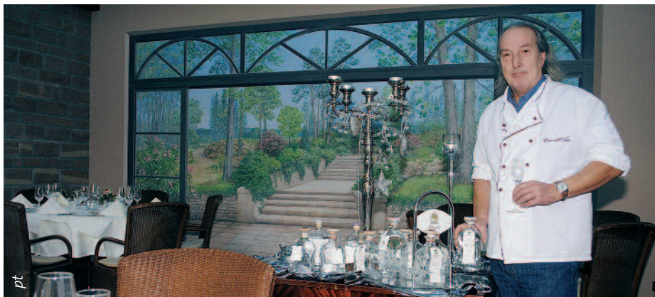
Danilo Biavaschi im Gasträum des Casa dell'Arte. Im Hintergrund das neu gestaltete Panoramabild einer idealisierten Wasgau-Landschaft.

„Gastronomie macht man entweder mit Liebe, oder man lässt es lieber“, nach dieser Philosophie verwöhnt Danilo Biavaschi – Patrone, Koch und Sommelier in einer Person – den Gaumen der Casa dell'Arte-Gäste. Biavaschi steht selbst in der Küche, zusammen mit zwei Gesellen, kreiert eigene Gerichte und achtet vor allem auf drei Dinge: Frische, Frische, Frische.