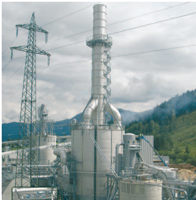
Mit einem Nasskohleelektrofilter können Feinstäube u. ä. abgetrennt werden.