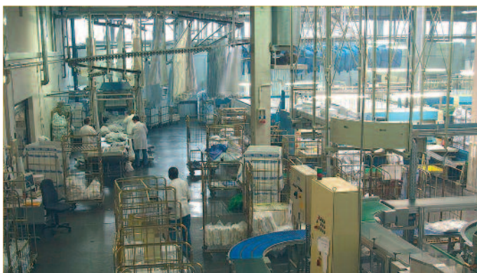
Blick in die Großwäscherei Haber Textile Dienste

Was „Erfolg“ bedeutet , ist bei Haber täglich zu sehen. Der absolute Schwerpunkt der Dienstleistung liegt auf dem Gesundheits- und Sozialwesen. Hierzu gehört die textile Vollversorgung von Krankenhäusern und Rehakliniken, inklusive der OP-Versorgung, sowie die Versorgung von Seniorenheimen mit Wäsche und die systematische Aufbereitung von Bewohnerwäsche. In diesem Segment werden rund 80 Prozent der Umsätze Erlöst. Im Bereich Mietberufskleidung versorgt Haber Industriekunden, Handwerk, Lebensmittelhersteller/-verarbeiter, die Pharmabranche sowie das Gesundheitswesen mit Imagekleidung, Schutzkleidung und