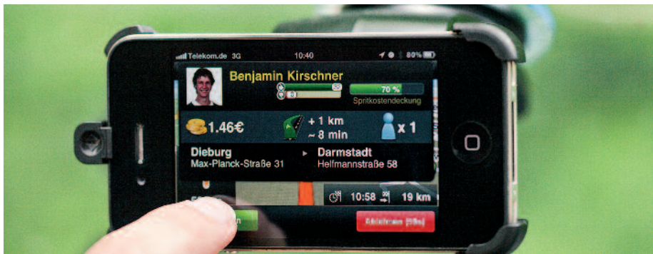
Intelligentes Fahrtstreckenmanagement mit dem Navigationsgerät