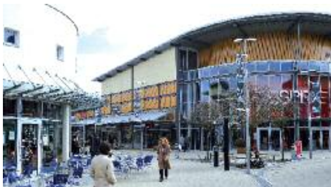
Die Style Outlets haben inzwischen ihre dritte Ausbaustufe erreicht.

„Die Kaufkraft in beiden Städten ist im Bundesvergleich weit unterdurchschnittlich – in Zweibrücken liegt die Kennzahl bei 94,5, in Pirmasens bei 90,5“, sagt Neuhardt. „Für den Bereich der alten Bundesländer liegen wir damit ziemlich weit hinten. Die Zentralität und die Umsatzkennziffer, mit der in Zweibrücken gerne geworben wird, unterliegt hier dem starken Einfluss des Outlet-Centers ‚The Style Outlets Zweibrücken‘ (früher DOZ - Designer Outlets Zweibrücken) und entwickelt sich ausschließlich wegen der dort getätigten Umsätze sehr gut. Das Gegenbeispiel liefert Pir-