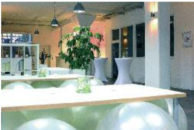
Die Werbeagentur Tailor & Partner hat ihre Geschäftsräume modern und kreativ gestaltet.

Als Full-Service Werbeagentur ging Tailor & Partner in Kaiserslautern April offiziell an den Start. Sie bietet Kunden neben klassischer Werbung, Gestaltung, Marketing- sowie Strategieberatung auch eine umfassende Veranstaltungsplanung sowie Kommunikationsmaßnahmen.