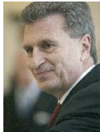
EU-Energiekommissar Günther H. Oettinger

Zudem müssen wir das Potenzial des „intelligenten“ Netzes in Kombination mit „intelligenten“ Stromzählern ausschöpfen. Durch ein besseres Management der Nachfrage könnten Netzbetreiber Spitzen und Täler bei der Erzeugung besser verwalten und Überkapazitäten (oft aus Kohle, Gas oder Öl) um bis zu 50 Prozent verringern. Durch eine bessere Kontrolle der Stromnutzung könnte der Verbraucher seinen Energieverbrauch bis zu 20 Prozent senken und so zur Verringerung der Gesamtnachfrage, Energiekosten und CO 2 -Emissionen beitragen. Es ist daher von entscheidender Bedeutung, die Herausforderungen für den Einsatz von „smart grids“ auf europäischer Ebene zu bewältigen, darunter auch den Finanzbedarf und technische Unsicherheiten im Bereich des Datenschutzes und der Standardisierung.