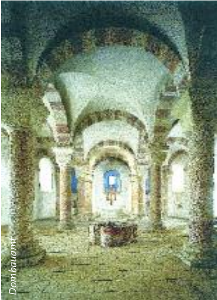
Die Krypta des Speyerer Kaiser- und Mariendoms ist die größte romanische Hallenkrypta weltweit. Sie bietet Raum für allein sieben Altäre und das möglicherweise älteste romanische Taufbecken nördlich der Alpen.