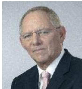
Bundesfinanzminister Dr. Wolfgang Schäuble

hältnis zu den Einnahmen überhöhten Ausgaben reduziert werden. Eine Konsolidierung über die Ausgabe Seite birgt zudem deutlich bessere Wachstumsaussichten als eine Konsolidierung über die Einnahmenseite. Auch der überwiegende Teil der Bevölkerung hat eine klare Präferenz für Ausgaben senkungen gegenüber Steuererhöhungen.