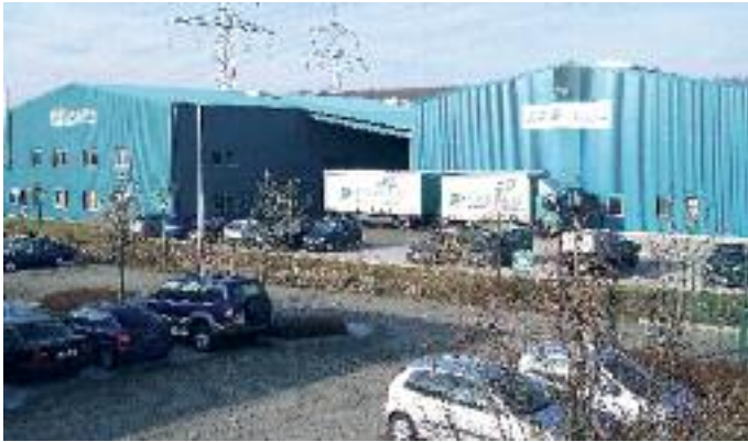
Feiert 35-jähriges Bestehen: Die TransPak-Gruppe.

Wirtschaftliche Erfolgsgeschichten gründen häufig auf einfachen, aber guten Ideen. So auch bei der TransPak-Gruppe. Vor 35 Jahren wurde in Gießen die TransPak GmbH gegründet. Sie bietet alles rund ums Verpacken an: Kartonagen, Klebebänder, Luftpolsterfolien, Transporthilfen und vieles mehr.