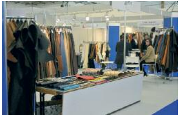
Mit PoS ist bei dieser Messe „Point of Shoe“ gemeint, ein auf Antrieb erfolgreicher Branchentreff, organisiert vom International Shoe Competence Center (ISC) in Pirmasens, die am 29. und 30. September in der Messe Pirmasens bereits eine zweite Auflage erlebt.

wieder da mit einer neuen Wirtschaftskraft. Gerade die Metallindustrie mit Schwerpunkt in Zweibrücken hat in den vergangenen Jahren eine Renaissance erlebt“, so Knüpfer. „Das Bruttoinlandsprodukt ist dort von 2000 bis 2008 um 37 Prozent gestiegen. Schuh ist wieder trendy und zukunftssicher. Überhaupt ist der Exportanteil von 2004 bis 2008 gestiegen. In den Bereichen Metall, Chemie, Elektro, Schuhherstellung und Schuhhandel um über 20 Prozent“, sagt Knüpfer. „Der regionale Branchenmix und der Anteil an mittelständischen Betrieben ist so günstig, dass die zurückliegende Finanzkrise nur wenig Dramatik entfachen konnte. Wir sind wieder da. Gleichwohl können wir neue Ansiedlungen oder Gründungen gebrauchen. Für die wirtschaftliche Entwicklung der Region ist der 4-spurige Ausbau der B10 unentbehrlich.“ (Alle Texte der „Heimatkunde Südwestpfalz“: Fred G. Schütz)