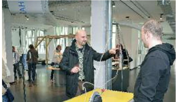
Das „Dynamikum“ in Pirmasens hat sich zum Besuchermagneten entwickelt.

Zu den großen gastronomischen Betrieben gehören die Hotelgruppe Zadra mit „Fasanerie“, „Rosengarten“ und anderen in Zweibrücken, das „Hotel-Restaurant Kunz“ in Pirmasens, die Lösch GmbH Hotel mit dem „Kloster Hornbach“ in Hornbach, die Hotel Pfalzblick KG in Dahn, „Bold's Hotel Zum grünen Kranz“ in Rodal-