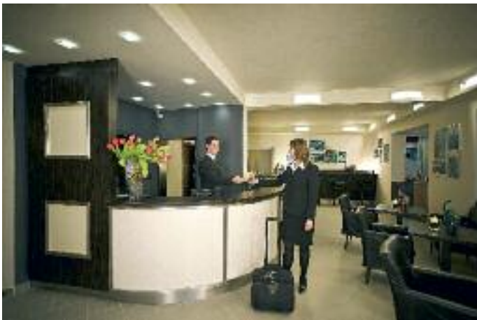
Die neu gestaltete Rezeption im Hotel Speyer.