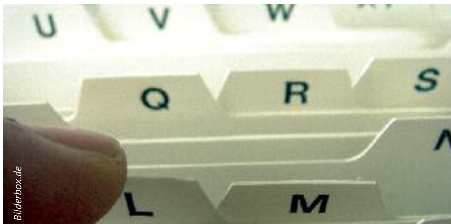
Achtung: Hände weg von einer Firmendatenabfrage der „Gewerbeauskunft-Zentrale“.